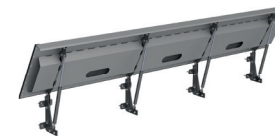
FSK-Wehr mit Gasdruckfeder