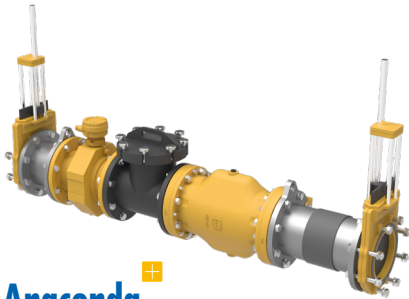
Anaconda mit IntelliFlow