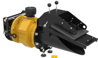
Alligator mit IntelliFlow